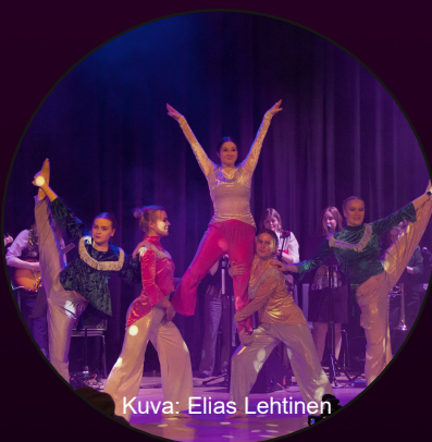
Kuva: Elias Lehtinen

Ei tarvinnut kuunnella marinaa vanhusten vain Olisi hiljaista jos oisin kodissain Jos minne lie polkuni vie Oli päivä tai synkkä yö niin määrään ain' Vanhainkodissain